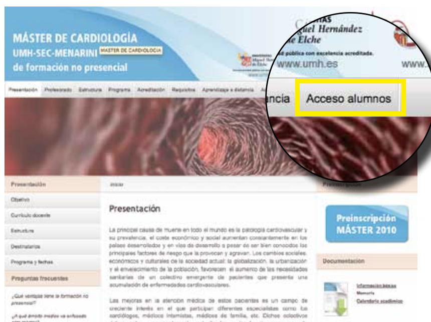
Página principal del Máster: www.mastercardiologia.com

Para entrar en el EVA deberá pinchar en el cuadro de diálogo "ACCESO ALUMNOS" situado en la pestaña gris superior derecha de esta página. El acceso a los módulos está restringido a los alumnos y profesores para garantizar la protección de todos los participantes del máster.